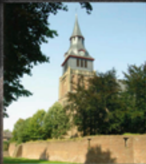
Katholieke Kirche Parochie- en bedevaartskerk van Sint Petrus en Sint Paulus