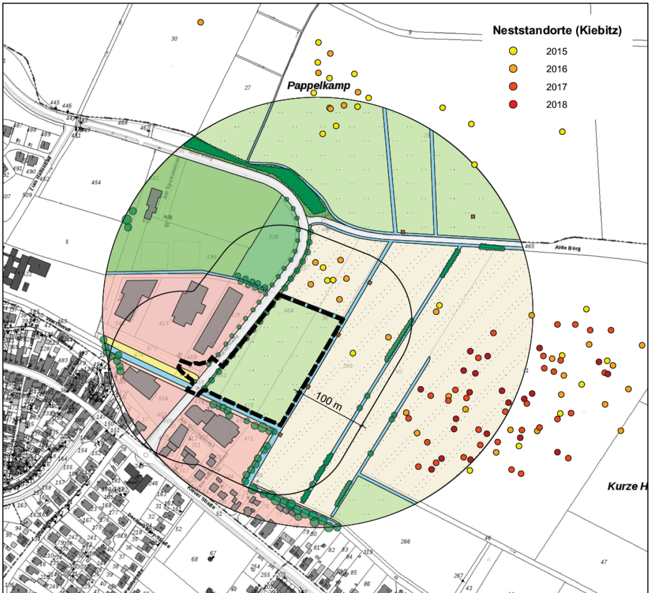
Abb. 1: Ergebnis der Nestkartierung (Kiebitzgelege) der Unteren Natur- schutzbehörde des Kreises Kleve für den Zeitraum von 2015 bis 2018.