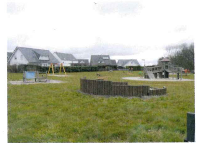
Abb. Blick in das Plangebiet aus südwestlicher Richtung. März 2016.