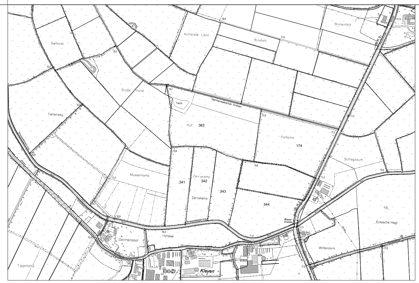
Lageplan M 1:10000