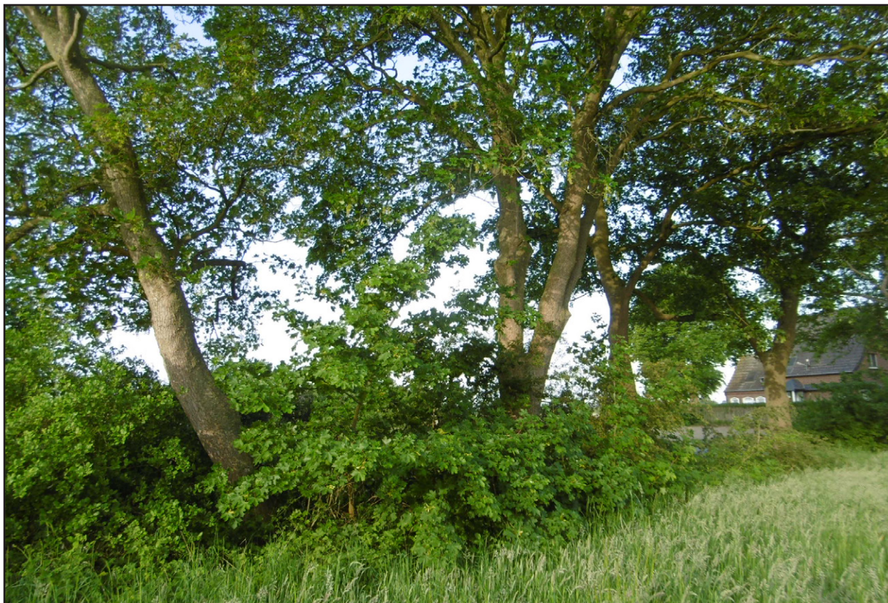
Abb. 5: Blick auf den Gehölzbestand von dem Vorhabengebiet aus.