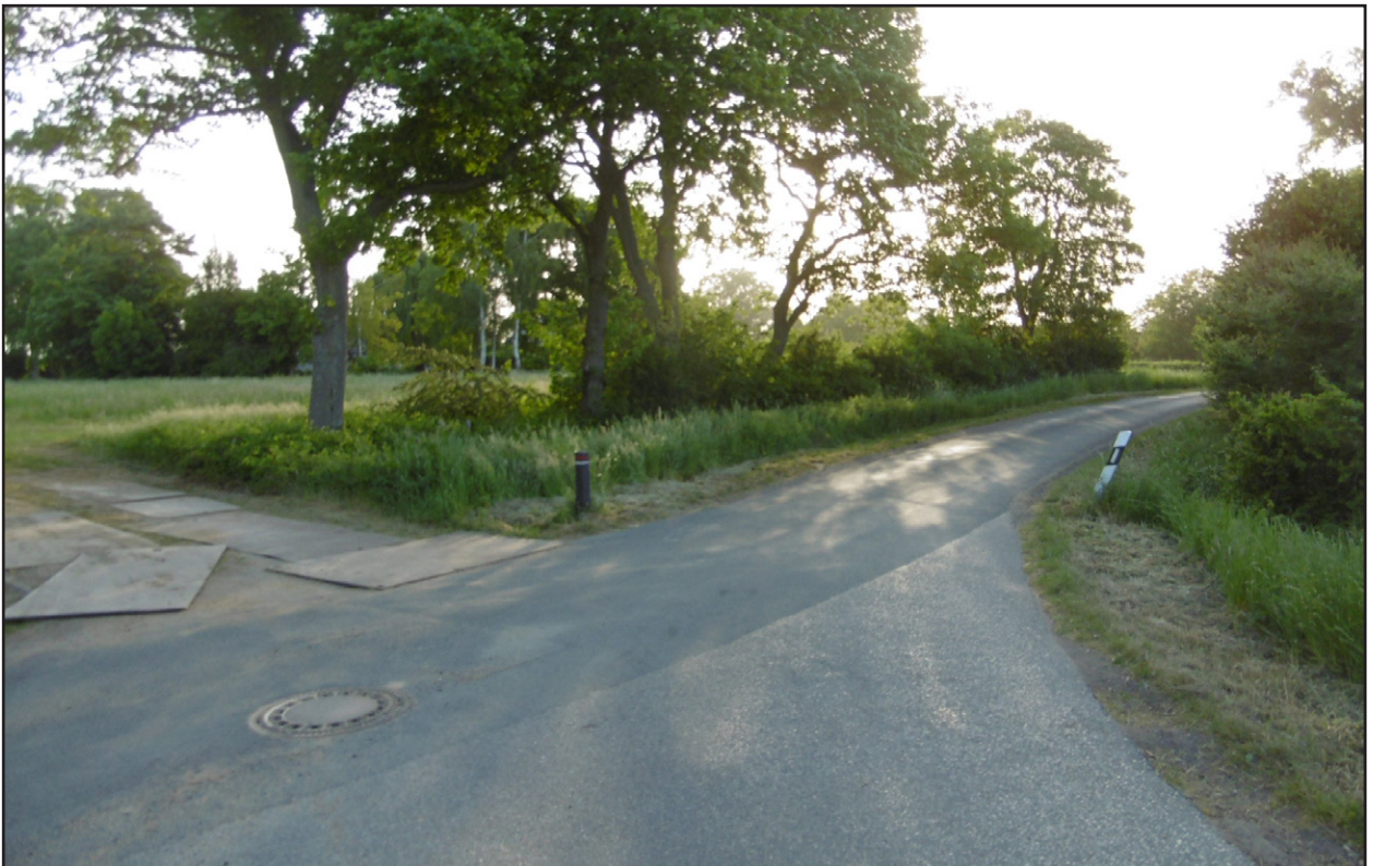
Abb. 4: Blick auf das Plangebiet von der Straße Stüvenest