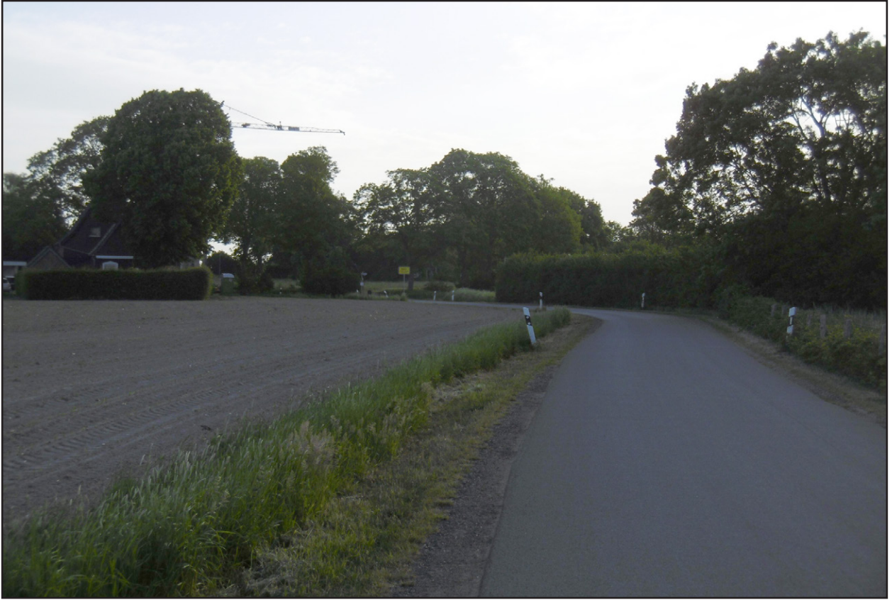
Abb. 3: Blick auf das Plangebiet von der Straße Lange Hufen im Süden