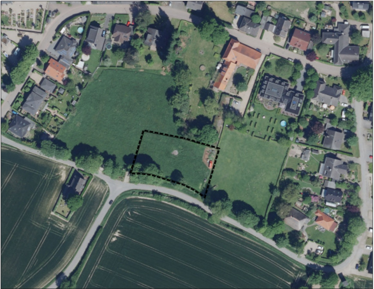
Abb. 2: Biotoptypen im Plangebiet

(Katastergrundlage Luftbild: Land NRW (2020) Datenlizenz Deutschland - Geobasis NRW - Version 2.0 ( www.govdata.de/dl-de/by-2-0 ))