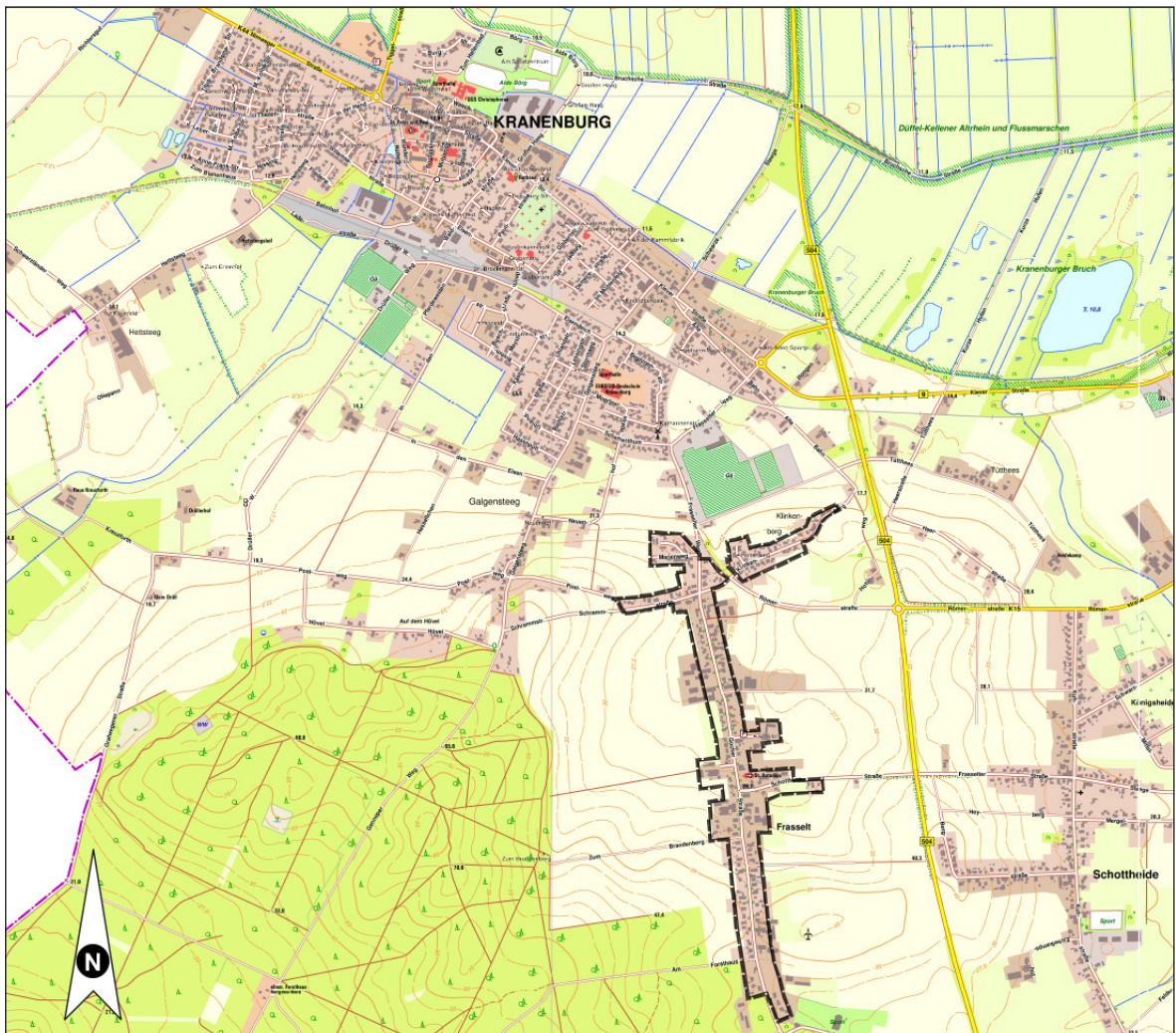
Abbildung 1: Lage des Geltungsbereiches für den Bebauungsplan Nr. 62 – Frasselt–, (Grundlage: Land NRW (2019) Datenlizenz Deutschland - Geobasis NRW - Version 2.0 ( www.govdata.de/dl-de/by-2-0 ))

Der Rat der Gemeinde Kranenburg hat am 28.03.2019 die Aufstellung des einfachen Bebauungsplanes Nr. 62 –Frasselt–, Ortsteil Frasselt gemäß § 2 Baugesetzbuch (BauGB) beschlossen. Das Ziel des Bebauungsplanes ist es, die zulässige Zahl der Wohnungen in Wohngebäuden im Plangebiet gemäß § 9 Abs. 1 Nr. 6 BauGB so zu steuern, dass der dörfliche Siedlungscharakter im Hinblick auf die Siedlungsdichte gewahrt bleibt.