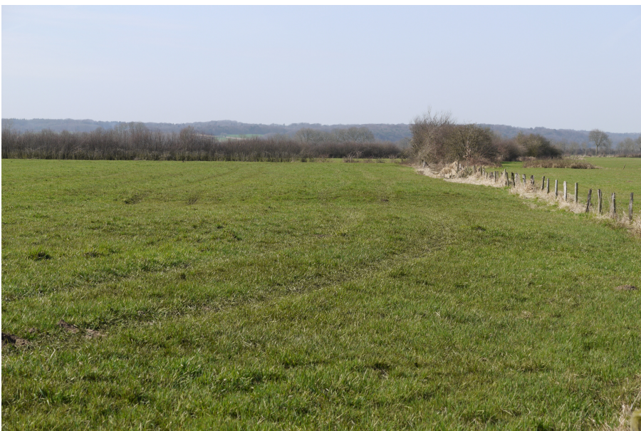
Abb. 2: Nördlicher Teilbereich der Maßnahmenfläche (Blick aus östlicher Richtung, März 2017).